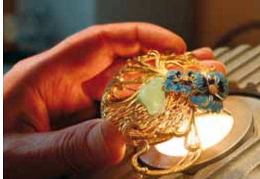
Ein echter Laliqe? - Unter dem Stereomikroskop erkennt der Sachverständige, dass die Linien gegossen sind, statt graviert.