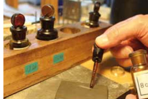
Strichprobe von Gold: Der Ring wird auf Schiefer gerieben und der entstandene Strich mit einer Prüfsäure bestrichen.